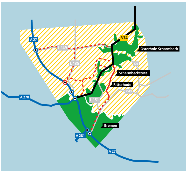
Der Planungsraum der B 74 – Ortsumfahrung Ritterhude

Neben 16 ständigen Mitgliedern aus Politik und Verwaltung, Verbänden, Vereinen und Initiativen sind auch acht Plätze für Bürger*innen reserviert. Interessierte können sich noch bis zum 15. Dezember für eine ständige Mitgliedschaft im Dialogforum bewerben. Aus allen Bewerbungen werden interessierte Bürger*innen anhand eines räumlichen Verteilungsschlüssels für die Gebiete Osterholz-Scharmbeck, Ritterhude, Blockland und Burglesum sowie für das restliche Umland ausgelost.