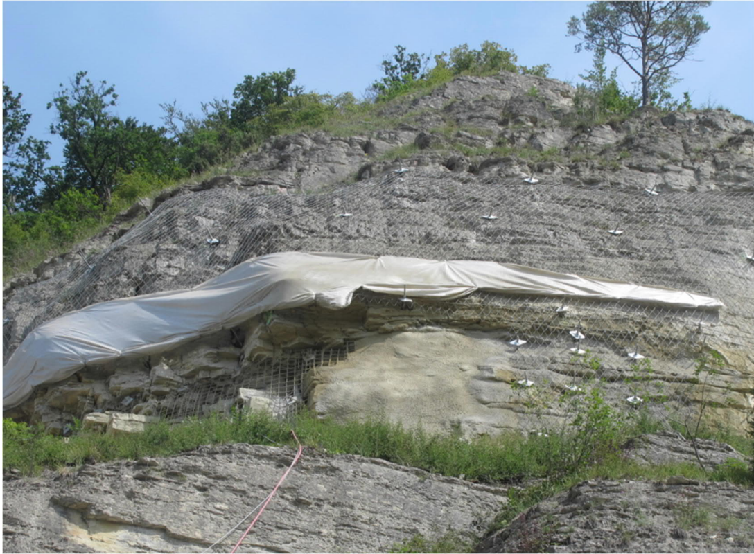
Die verschiedenen Arbeitsschritte sind zu erkennen.