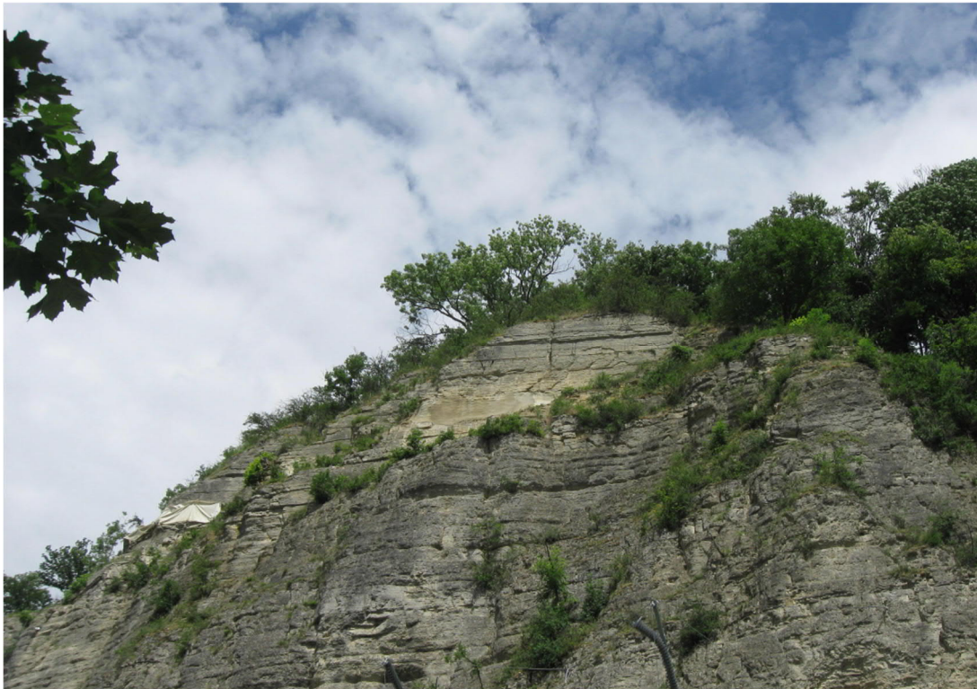
Hier ist eine fertig gestellt Spritzbetonsicherung zu sehen.