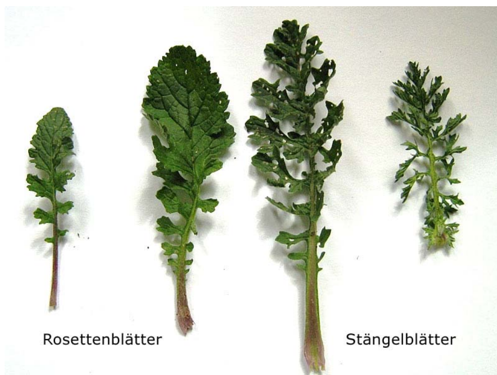
Abbildung 4 Rosettenblätter und Stängelblätter im Vergleich Abb. LWK Nordrhein-Westfalen

Am Boden bildet die Pflanze vor dem Höhenwachstum Rosetten und ist damit für das geübte Auge schon in diesem Stadium zu erkennen. Rosettenblätter sind am Stängelansatz fiederförmig, während die Stängelblätter durchgehend fiederförmig sind.