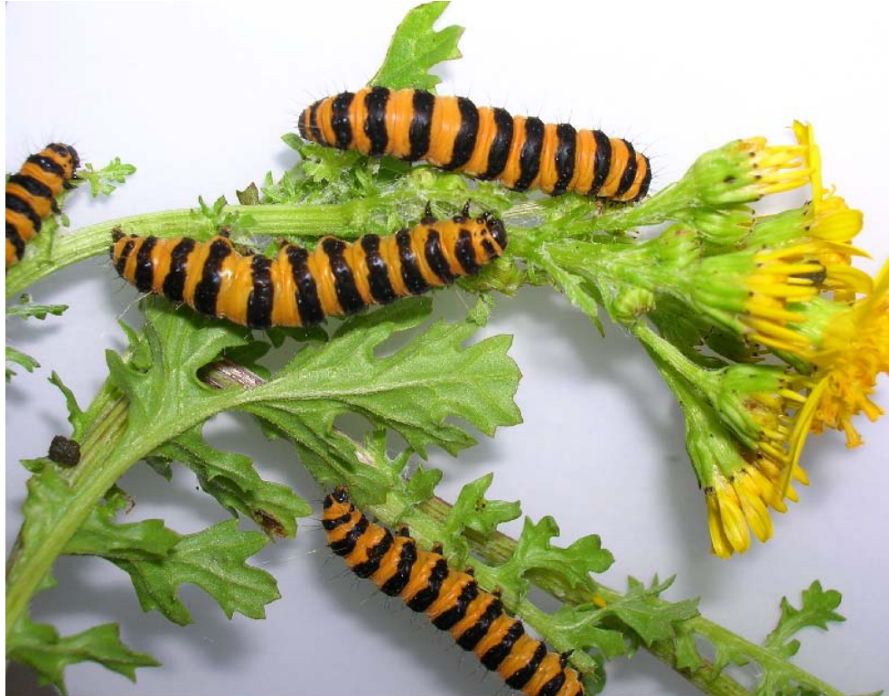
Abbildung 5 Raupen des Jakobskrautbären am Jakobs-Greiskraut Abb. LWK-Niedersachsen

Daneben gibt es als Gegenspieler auch spezialisierte Blattrandkäfer oder Saatfliegen. Auch Rostpilze sind in der Lage, die Pflanze zu schädigen. Diese Antagonisten werden unter dem Aspekt der biologischen Bekämpfung diskutiert. Praxisreife biologische Verfahren sind aber noch nicht in Sicht.