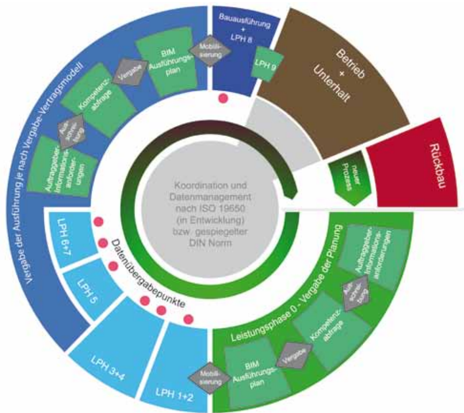
Abbildung 2: Schematische Darstellung des BIM-Referenz-Prozesses (planen-bauen 4.0 GmbH)

Die AIA zu Beginn des Projekts (grüner Bereich) können bereits teilweise auf der Anwendung von BIM basieren, da Visualisierungen dem Auftraggeber helfen können, die von ihm präferierte Projektvariante auszuwählen.