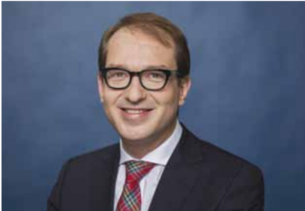
Alexander Dobrindt MdB Bundesminister für Verkehr und digitale Infrastruktur

Die Digitalisierung ist eine Substanzrevolution von Wirtschaft und Gesellschaft. Sie verändert die Voraussetzungen für das Wachstum, den Wohlstand und die Arbeit von morgen – und revolutioniert in einem disruptiven Prozess Industrien und Dienstleistungen, Wertschöpfungsketten und Produktionsprozesse, Innovations- und Produktlebenszyklen.